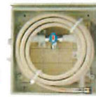
専用ガス供給ボックス