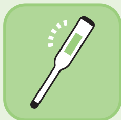
職員の体温測定等 健康管理の徹底