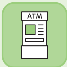
ATMやインターネット バンキング等のご活用