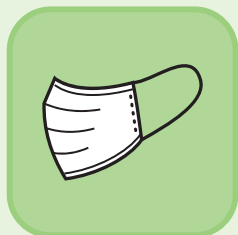
職員のマスク着用