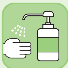
ご来店時の 手指の消毒