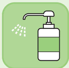
支店内各所、ATM に消毒液の設置