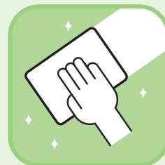
支店内の 清掃、消毒