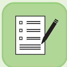
来客者の名簿記録