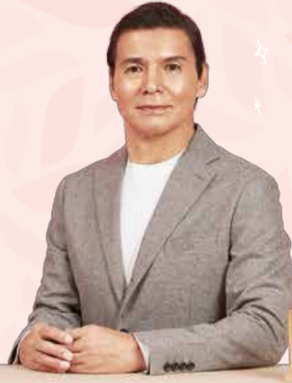
ナビゲーター 阿部 祐二さん