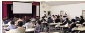
通常総会 みそ作り教室