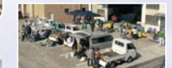
ミニミニ軽トラ市