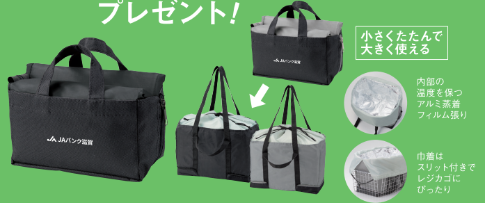
商品サイズ：使用時/260×400×180mm、収納時/約110×230×90mm 2色（ブラック・グレー）の内、いずれか1つプレゼント

【お申し込み期間】 令和5年2月1日（水）～5月31日（水）まで 【お申し込み方法】 専用の応募ハガキ、もしくはハガキに記載のURLから お申し込みください。