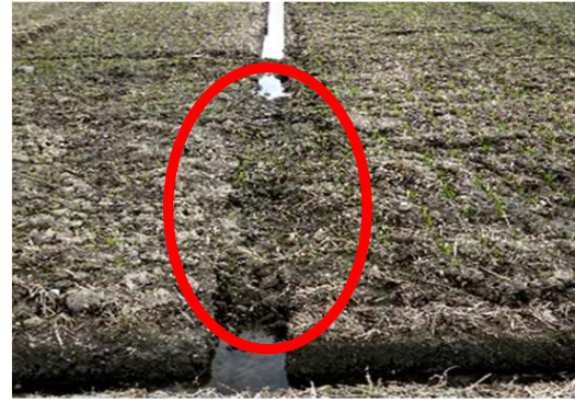
排水溝がふさがっており、溝さらえが必要

排水不良による湿害は、収量・品質の低下を招きます。溝が崩れるなどして明渠に滞水がある場合は溝さらえ等を行い、速やかに排水しましょう。