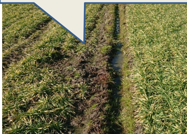
排水溝の滞水による湿害の影響