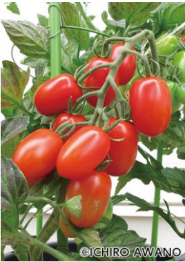
病気に強く、裂果が少なく、肉厚で甘みが強い多収のプラム型のミニトマト

トマトの遠い先祖は、南米アンデス高原で生まれました。大玉トマトは、最後に行き着いたメキシコの標高2000m付近で大ぶりに発達したのに対し、ミニトマトは中米を経てメキシコへ至る標高0～2000mのさまざまな環境で広く自生しています。そのため大玉トマトが涼しく乾燥した環境を好み夏は苦手ですが、ミニトマトは過酷な日本の環境でも栽培しやすいです。ただ丈夫であるが故に果実が付き過ぎ草勢が弱くなりがちです。そこで第2花房の着果から週1回追肥を施して草勢を維持します。果実が割れやすいのも欠点です。特に収穫前が雨だと割れやすいので早めに収穫を。雨に当たないように軒下へ鉢を移動するのも方法です。品種は、草勢が強く、耐病虫害性があり、裂果しにくい高糖度品種を選びます。