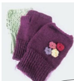
ハンドウォーマー