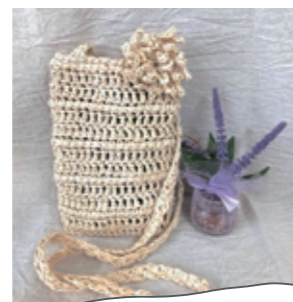
スマホポシェット