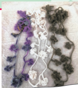
ブローチ&ラリエット