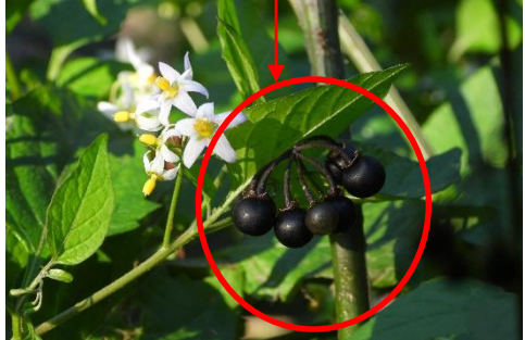
イヌホオズキ・・・ブルーベリーのような果実

汚損粒の発生要因です。ご注意ください。特にイヌホオズキは少しでも入ると着色しますのでお気を付けください！！