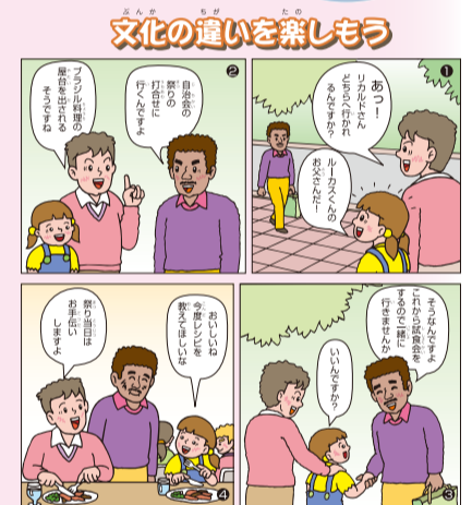
ともに生きる社会をめざして 2021年(令和3年)12月現在、滋賀県には、世界の106ヵ国・地域、約33,000人の外国人が暮らし、その多くは、就労のために日本にきた南米・東南アジアの人々や歴史的経緯からやむを得ず日本に住まなければならない韓国・朝鮮の人々です。多様な文化や価値観を尊重し、お互いに尊重し合って、ともに生きる地域社会づくりが求められています。 出典:「こころやわらかく」(改訂版)2023年(令和5年)3月 滋賀県人権施策推進課 発行